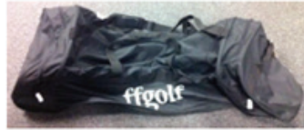
120 balles (dans 2 sacs)